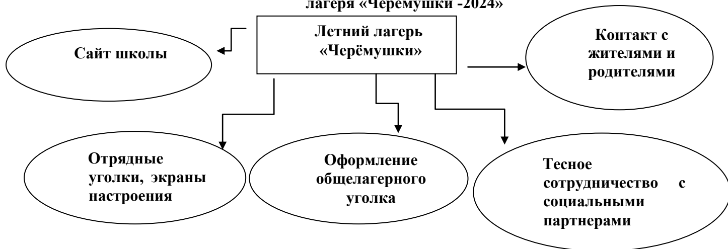
Схема информирования общественности и родителей о деятельности летнего лагеря «Черёмушки -2024»